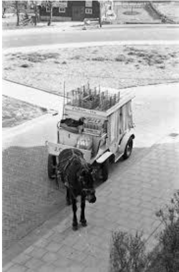
De melkboer met paard en wagen

Ik kan u beloven dat dit een stuk is dat u met een glimlach van herkenning zult lezen en ook als u niet van Margraten bent. U zult het verhaal herkennen uit uw eigen dorp.