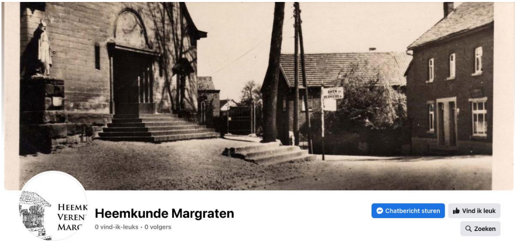
Printscreen van de nieuwe facebookpagina van Heemkunde Vereniging Margraten